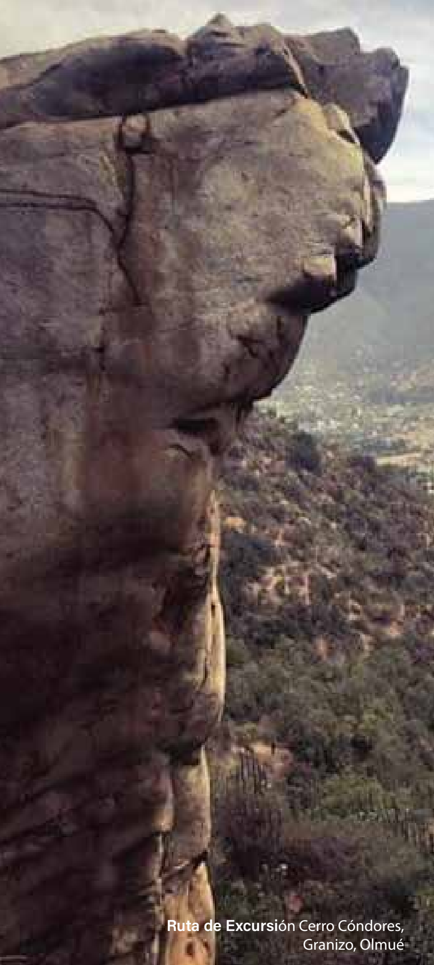
Ruta de Excursión Cerro Cóndores, Granizo, Olmué